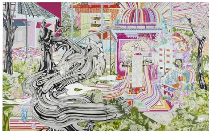
水野 里奈(みずの りな) 「みてもみきれない。」 ボールペン、油彩、カンヴァス [227.3cm × 363.6cm]