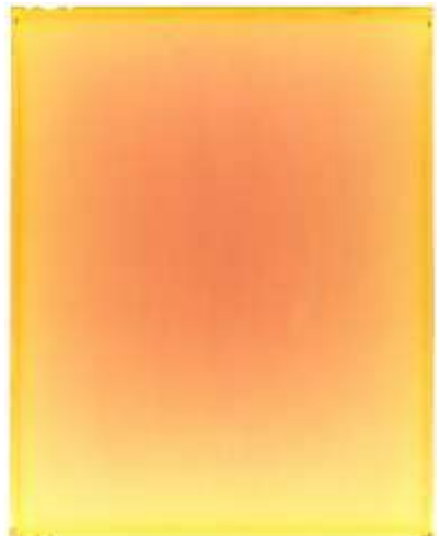
川久保 ジョイ(かわくぼ じょい) 「千の太陽の光が一時に天空に輝きを放ったならば」 ピグメントプリント [300cm × 240cm]