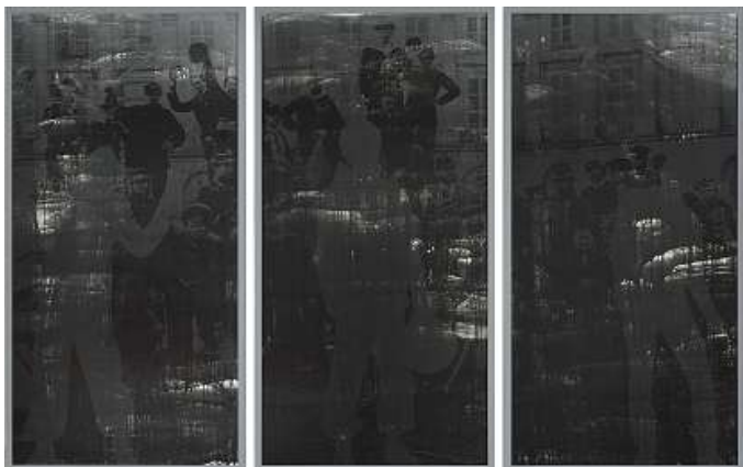
岸 幸太(きし こうた) 「BLURRED SELF-PORTRAIT」 ゼラチンシルバープリント [169.6cm × 268.8cm (額込み)]