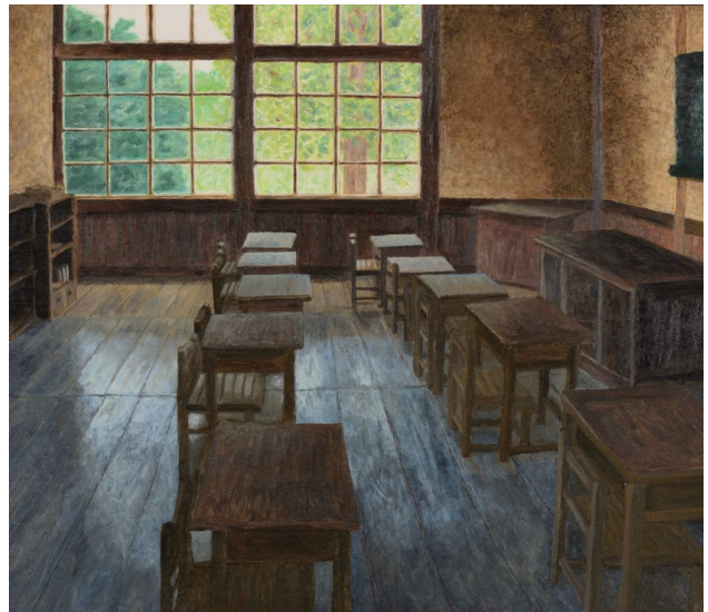
〈自由部門〉上野の森美術館賞 眞壁 正「廃校」