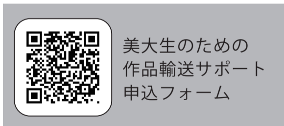
美大生のための 作品輸送サポート 申込フォーム

*作品の返却時期には、大学を卒業（大学院を修了）している方や、 ご自宅などへの作品輸送を希望する方は、別途料金を申し受けることにより、 返却先を変更できますので、お申し込み時にご選択ください。