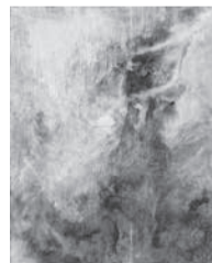
優秀賞・フジテレビ賞 吉田沙織《喪失して尚、混在する。mixed with loss.》日本画 F100