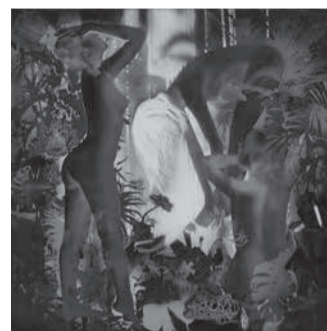
上野の森美術館絵画大賞 王青《玄牝》アクリル S100