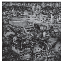
優秀賞・産経新聞社賞 茂木瑠《星座一窓からの風景一》油彩 S100