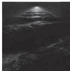
優秀賞・ニッポン放送賞 伊庭広人《展望231 希望への始まり2014》油彩 S100