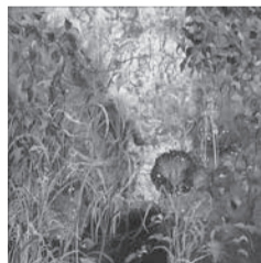
優秀賞・彫刻の森美術館賞 柏木久美子《絢の庭》日本画 S100