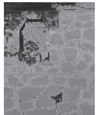
優秀賞・彫刻の森美術館賞 胡日查《時間の肖像II》油彩 F100