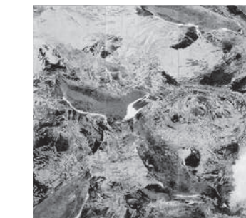
優秀賞・フジテレビ賞 清水航《飛流》日本画 S100