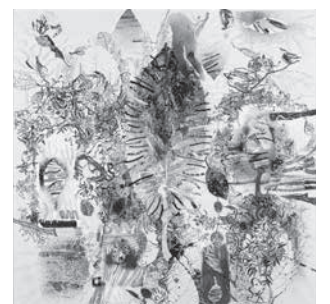
優秀賞・ニッポン放送賞 池内悦子《葉状の風景》墨、和紙、胡粉 S100